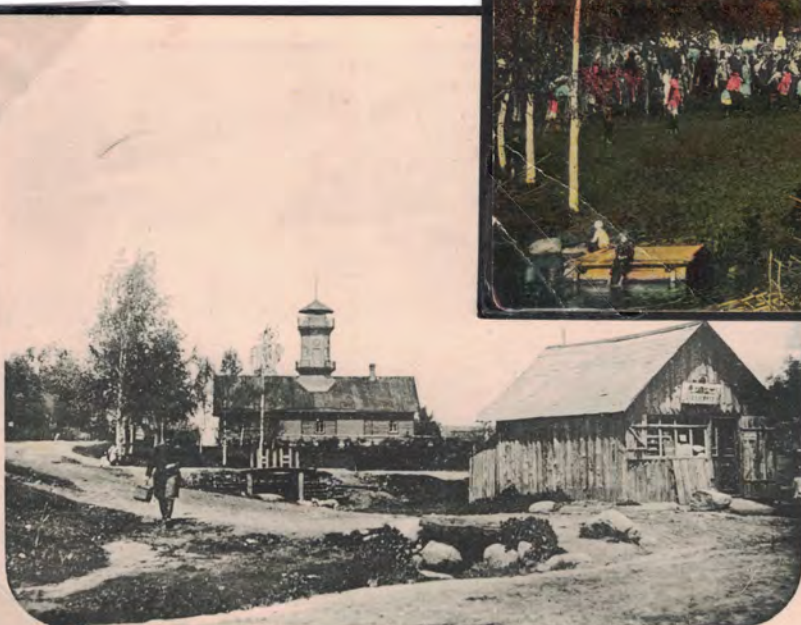
СИВЕРСКАЯ — Пожарное Депо